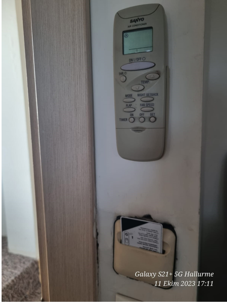
Galaxy S21+ 5G Hallurme 11 Ekim 2023 17:11